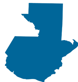
Diagrama 2. Países según avances en la vinculación presupuesto - ODS

En Guatemala , del ejercicio de articulación entre la Agenda 2030 y el Plan Nacional de Desarrollo se estableció una estrategia de implementación la cual contempla las prioridades nacionales de desarrollo. Uno de sus componentes, “financiamiento para el desarrollo”, plantea la asignación de recursos para la implementación efectiva de dichas prioridades, las cuales están a su vez articuladas con los ODS (Secretaría de Planificación y Programación de la Presidencia 2019, 61). En el ámbito del financiamiento público se plantea además una readecuación presupuestaria, una reforma fiscal integral y una alineación de recursos de otros actores con el objetivo de armonizar el Plan Nacional de Desarrollo con los ODS, por ejemplo a través de la cooperación internacional (Secretaría de Planificación y Programación de la Presidencia 2019, 61)